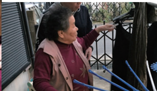
通所リハビリテーション