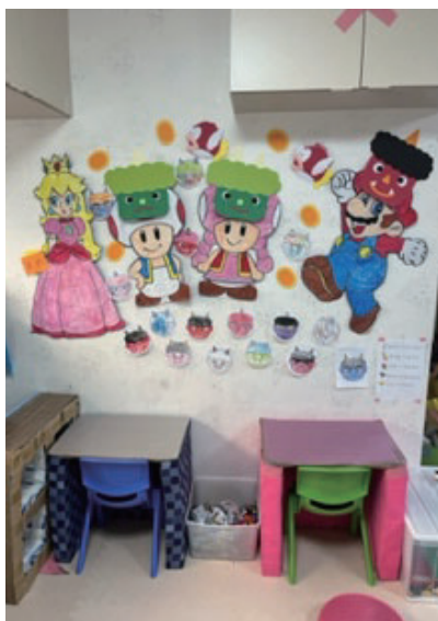
▲みんなで作った飾り絵