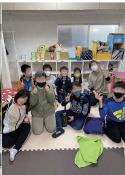
▲アイビーのお友達