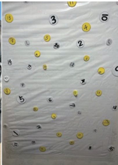
▲ビジョントレーニング