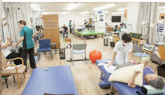
訪問リハビリテーション