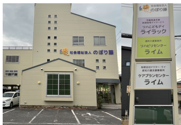
リハこどもデイ ライラック / リハビリセンター ライム