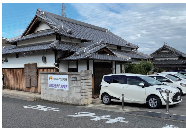
リハこどもデイフクシア