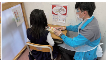
▲2F 机上フロア 学習・個別訓練など